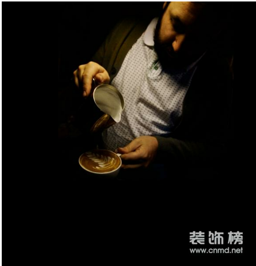
HDD展会咖啡师“拉花”表演

在传统住宅地产仍受抑制情况下, 商业地产却一路高歌猛进, 日前, 保利、万科等大型房企均表示将加重商业地产比例。据《2011中国房地产开发企业500强测评研究报告》显示, 排名前20名的开发商都选择“从商”。作为商业地产重要组成部分, 酒店业借此东风, 与地产开发商合作顺势扩张。“酒店热”也催生了相关产业的勃兴。