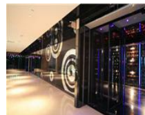
迷情百合 梦幻娱乐会所