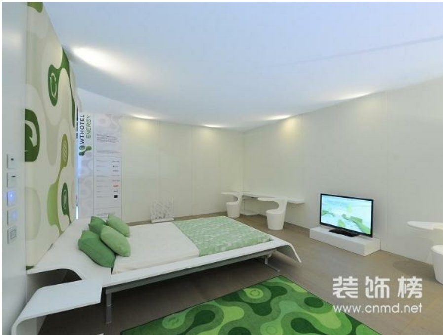
HDD展星级酒店样板房区—意大利酒店集团WT Hotel样板房展示

无论是进军二三线城市，还是与大型开发商结盟，国际酒店品牌无疑都是在抓住中国商业地产爆发式发展，进一步在中国开疆扩土。以洲际集团为例，这一全球最大的酒店集团目前已在华开出170家酒店，并计划5年内将在华酒店数量增加到300家。在这些项目中，有9个项目都是与保利合作，10个项目是与成都会展旅游集团合作，各有6个项目分别与万达和世茂合作。