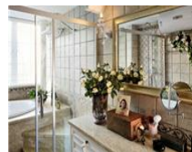
旧房华丽转身田园豪宅