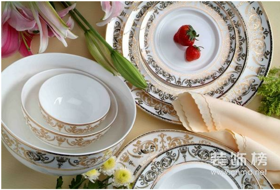
2001年上海APEC首脑峰会国宴用瓷玛戈隆特骨瓷