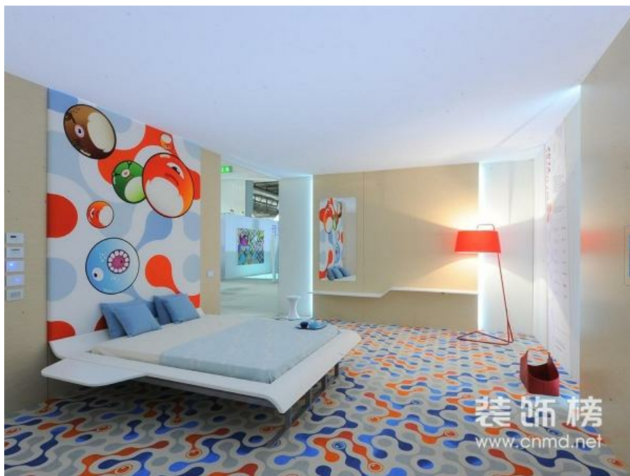
HDD展星级酒店样板房区—意大利酒店集团 WT Hotel样板房展示

美元疲软、欧债危机等世界外围经济低迷似乎并未对中国的酒店业发展造成太大影响。2011年4季度，在国内新开酒店中，五星级酒店数量占比超过八成。统计数据显示，去年4季度，国内开业的星级酒店数为56家，客房总数超过16748间（套）。其中尤以五星级酒店数量突飞猛进，所占比例一跃至86%，国际联号酒店开业数量也持续上涨，所占比例也超过总数的一半。2011年中国酒店客房总数为200万间套，预计2016年可达到500万间套，截至目前中国还有1700家星级酒店正在建设之中。