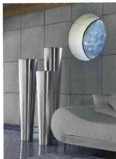
Perfetti per arredare gli spazi comuni, i vasi oversize della collezione Narya sono disegnati da Albino Celato per De Castelli. Sintesi di tecnologia produttiva e lavorazione artigianale

ambientabili e funzionalissimi, questi tavolini si caratterizzano per un senso di leggerezza che deriva dagli spessori contenuti dei piani in lamiera e dei montanti a sezione cava. Di forma rotonda e verniciati opachi in bianco e in nero, sono accoppiabili tra loro e nella versione piccola, anche con top in cuoio o in frassino. "Si tratta di un gruppo di oggetti di diverse forme e misure - spiegano gli architetti - che possono essere usati singolarmente, accoppiati o incastrati tra loro. Sono leggeri anche nella forma e sembrano costruiti con fogli di carta, distanziati da gambe anch'esse in carta ripiegata, perché li volevamo sottili e leggeri per bilanciare i volumi, per poter facilmente muovere e accostare i diversi pezzi tra loro. E proprio questa possibilità di incastro e integrazione, li rende molto flessibili nell'uso e particolarmente adatti agli ambienti pubblici, come le hall degli alberghi. Anche per esperienza personale, abbiamo pensato che quando