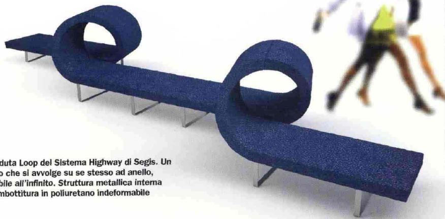
La seduta Loop del Sistema Highway di Segis. Un nastro che si avvolge su se stesso ad anello, ripetibile all'infinito. Struttura metallica interna con imbottitura in poliuretano indeformabile

ambientabili e funzionalissimi, questi tavolini si caratterizzano per un senso di leggerezza che deriva dagli spessori contenuti dei piani in lamiera e dei montanti a sezione cava. Di forma rotonda e verniciati opachi in bianco e in nero, sono accoppiabili tra loro e nella versione piccola, anche con top in cuoio o in frassino. "Si tratta di un gruppo di oggetti di diverse forme e misure - spiegano gli architetti - che possono essere usati singolarmente, accoppiati o incastrati tra loro. Sono leggeri anche nella forma e sembrano costruiti con fogli di carta, distanziati da gambe anch'esse in carta ripiegata, perché li volevamo sottili e leggeri per bilanciare i volumi, per poter facilmente muovere e accostare i diversi pezzi tra loro. E proprio questa possibilità di incastro e integrazione, li rende molto flessibili nell'uso e particolarmente adatti agli ambienti pubblici, come le hall degli alberghi. Anche per esperienza personale, abbiamo pensato che quando