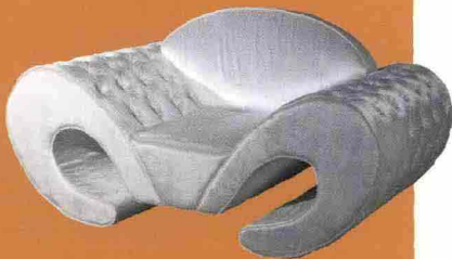
Il suggestivo design della poltrona Silouette firmata da Vincenzo Antonuccio e Mariena Calbini per VG Newtrend. Lavorazione artigianale capitonné con bottoni in acciaio cromato