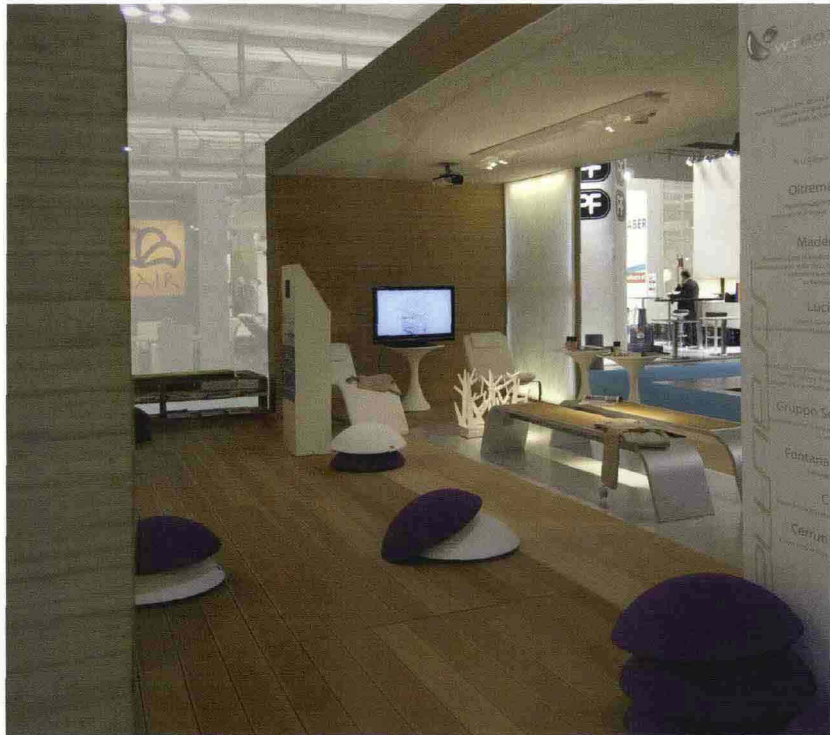
TECNODECK È STATO UTILIZZATO NEL PROGETTO WT HOTEL DI WELL-TECH, UN ALBERGO TECNO-SENSORIALE FATTO DI MATERIALI MUTEVOLI, INTERATTIVI ED ECO-COMPATIBILI