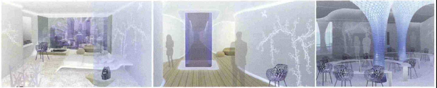
IL PROGETTO È STATO REALIZZATO DALL'ARCHITETTO CHIARA CANTONO THE PROJECT WAS DESIGNED BY THE ARCHITECT CHIARA CANTONO