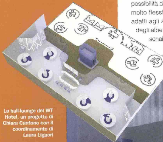
La hall-lounge del WT Hotel, un progetto di Chiara Cantono con il coordinamento di Laura Liguori